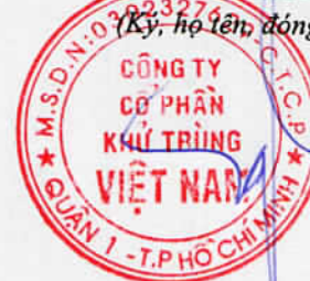
Trương Công Cứ